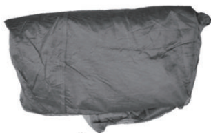
Internal account X1