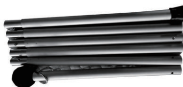
Support rod X1