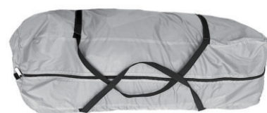
Outer bag X1