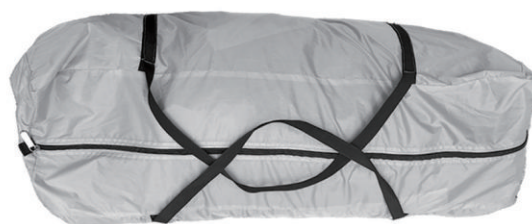
Outer bag X1