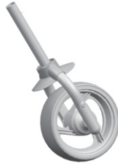
Front wheel/Roue avant/ Vorderrad/Rueda frontal /Roda dianteira/ Ruota anteriore