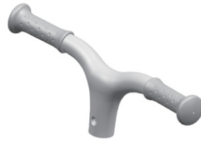
Handlebar/Guidon/Lenkstange /Barra del manillar/Barra do guidom/Manubrio