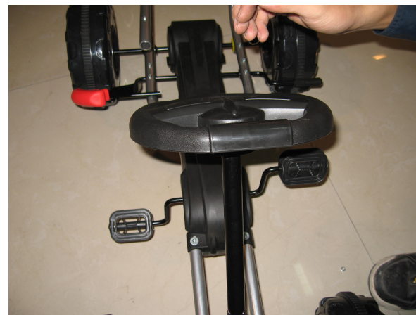
D. Fixez le volant et fixez-le avec la vis 5 * 25