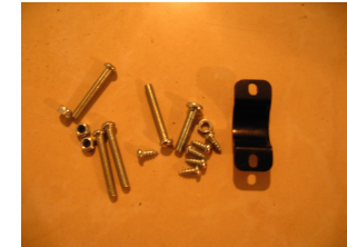
H. un sac de vis