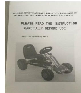
I. Une sp cification