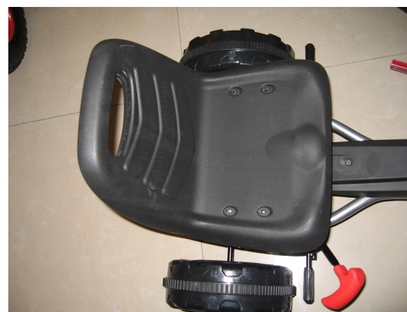
H. Fixez le siège avec la vis 5 * 35