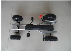
A. Un cadre