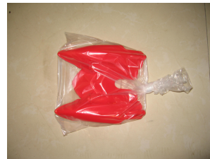
D. Un avant du véhicule