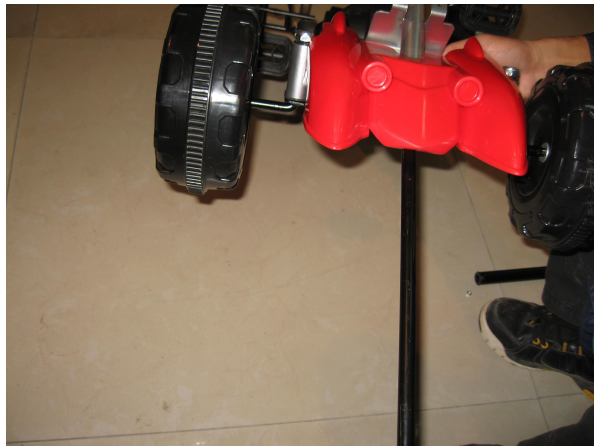
B. Mettez l'arbre de direction à travers le cadre