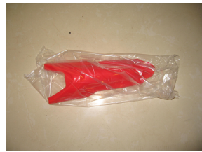
B. Panneau avant