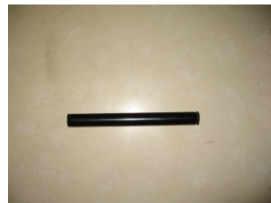
E. un tube de revêtement