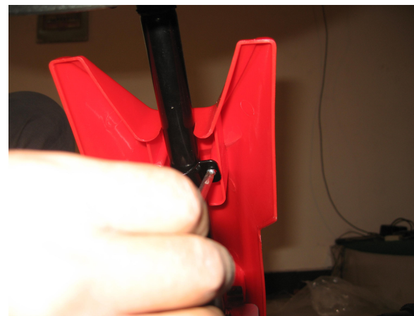
G. Fixez le haut du panneau avant avec la vis 4 * 10