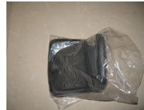
G. Une si ge