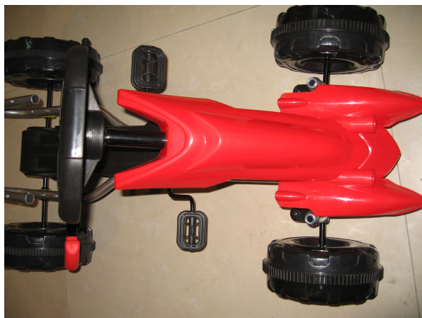
E. Fixez le panneau avant sur le cadre