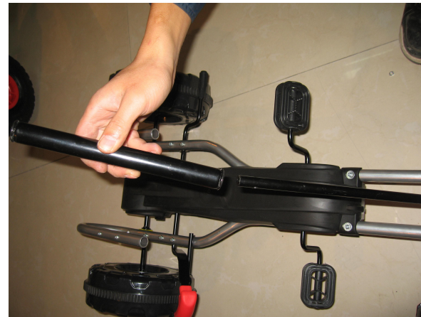
C. Mettez l'arbre de direction à travers le tube de revêtement