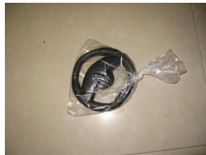
C. Un volant