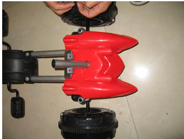
A. Fixez l'avant du véhicule avec la vis 4 * 10