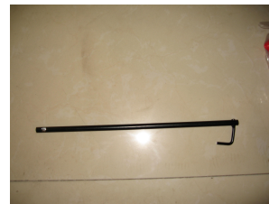
F. un arbre de direction