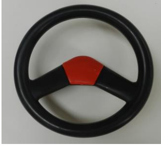
1. Ein Lenkrad und eine Lenkradabdeckung