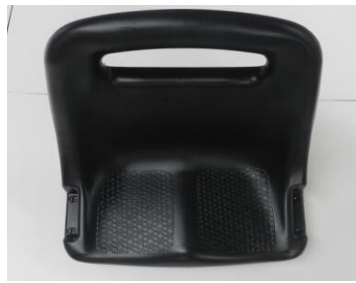
2. Ein Sitz