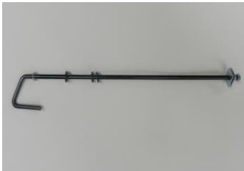
3. Eine Lenkwelle Lenkungsunterstützung