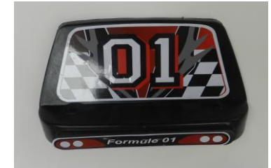
6. Ein Nummernschild

1 Stck. 5*14 Unterlegscheibe 1 Stck. 5*12 Unterlegscheibe 1 Stck. Mutter