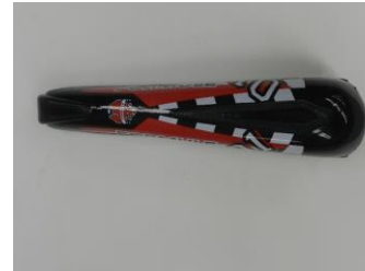
5. Eine Frontplatte