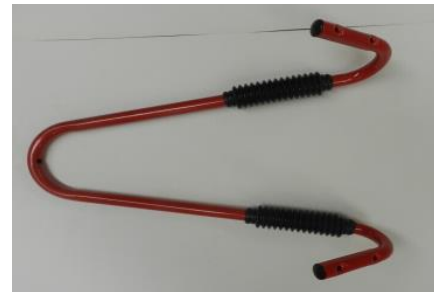
4. Un soporte de dirección