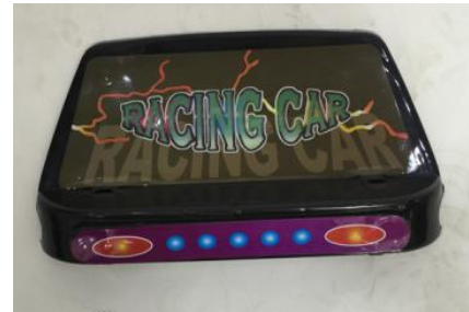
6. Una placa