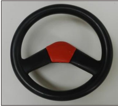
1. Un volante y cubierta del volante