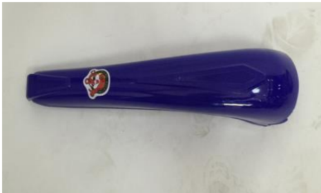
5. Un panel frontal