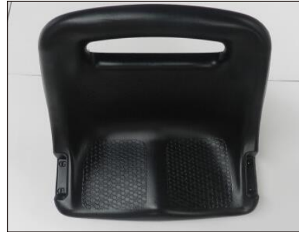
2. Un asiento