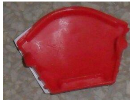
8. Cubierta del volante