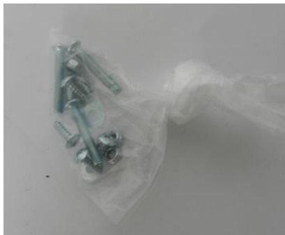
7. Bolsa de tuercas y tornillos (Tornillos 4 x M5*40mm, Tornillos 4 x M5*45mm, Tornillos 2 x M5*50mm)