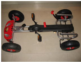
A、 Kart Chassis