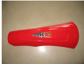
C、 Front Faring