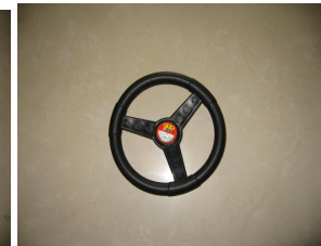
E、 steering wheel