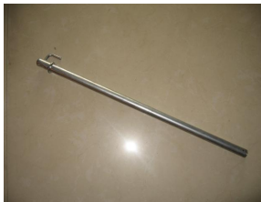
D、 steering shaft