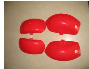
F、 Mud Guards