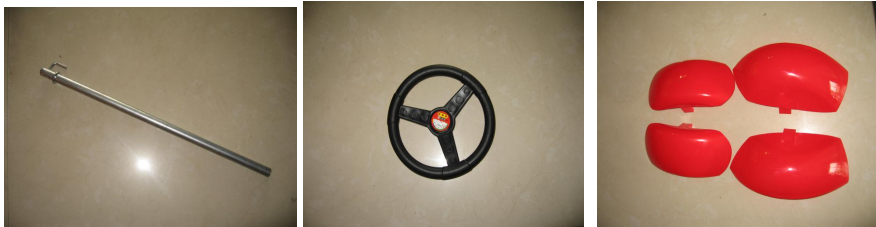
D. Eje de dirección E. Rueda de volante F. Loderas