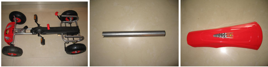
A. Chasis de coche B. Tubo de dirección C. Carenado delantero