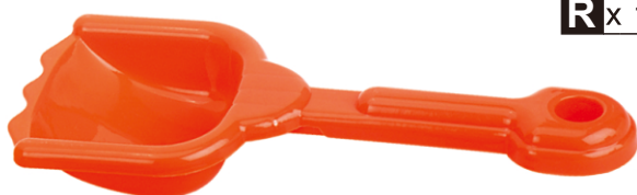
R x 1