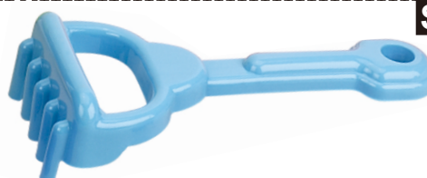
S x 1