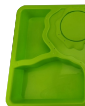
C x 1