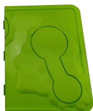
D x 1