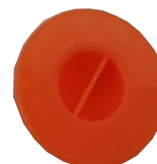
Q x 2