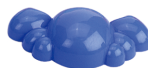
N x 1