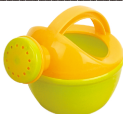
M x 1