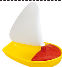
P x 1