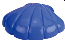
O x 1