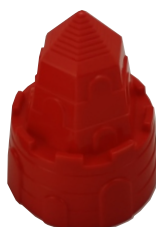
G x 1