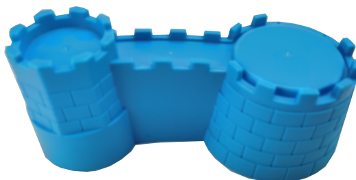
E x 1