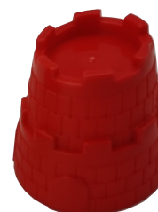
H x 1