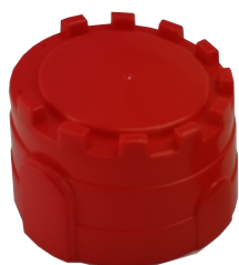
F x 1