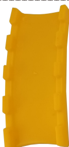
I x 1