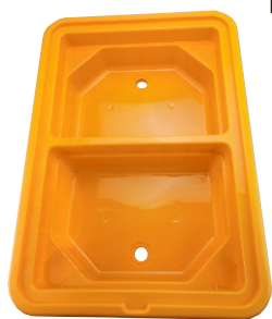
A x 1